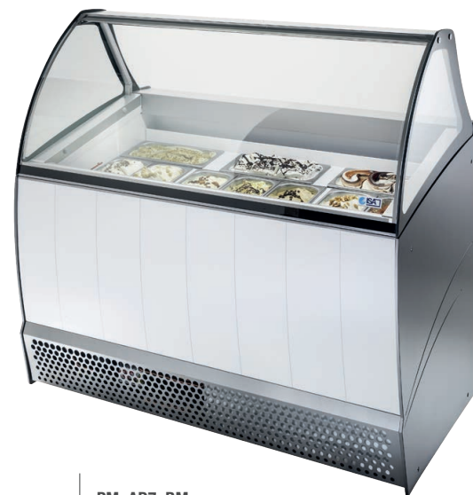
LX PM_AD7_BM Front sticker (standard) Adesivo frontale

Colori disponibili Available colours Fianchi laterali / Griglia inferiore Side panels / Bottom front grid Grigio E_Z065