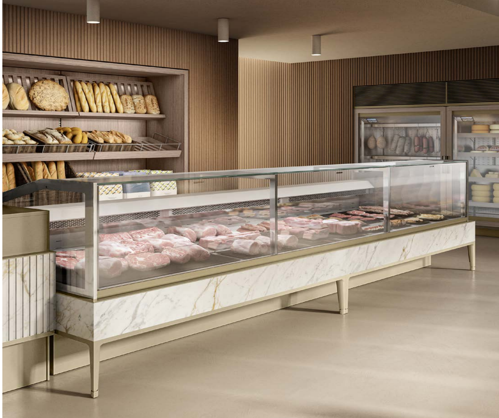
ISA Pentagram Deli 375

Алматы (727)345-47-04 Ангарск (3955)60-70-56 Архангельск (8182)63-90-72 Астрахань (8512)99-46-04 Барнаул (3852)73-04-60 Белгород (4722)40-23-64 Благовещенск (4162)22-76-07 Брянск (4832)59-03-52 Владивосток (423)249-28-31 Владикавказ (8672)28-90-48 Владимир (4922)49-43-18 Волгоград (844)278-03-48 Вологда (8172)26-41-59 Воронеж (473)204-51-73 Екатеринбург (343)384-55-89